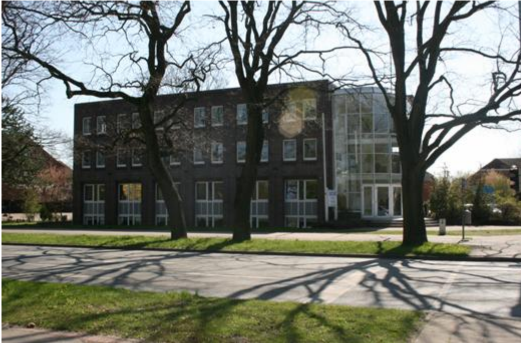
Bürolage (Entfernung ca. 1 km)