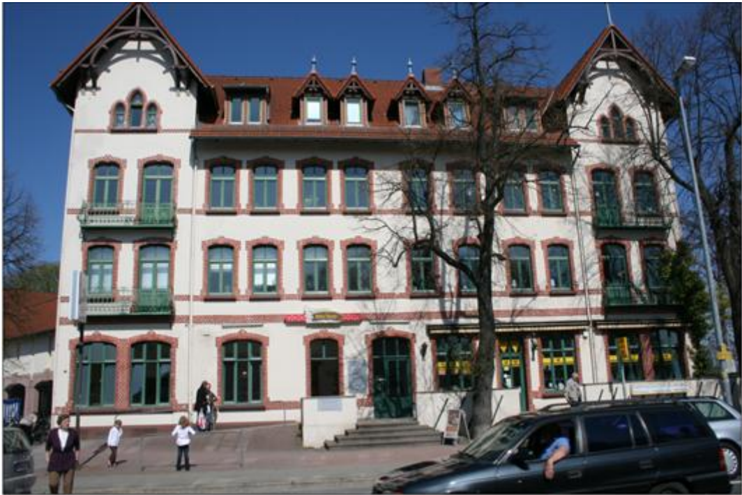
Denkmalschutzobjekt (Post, Bäcker, Büro), Entfernung ca. 50 m