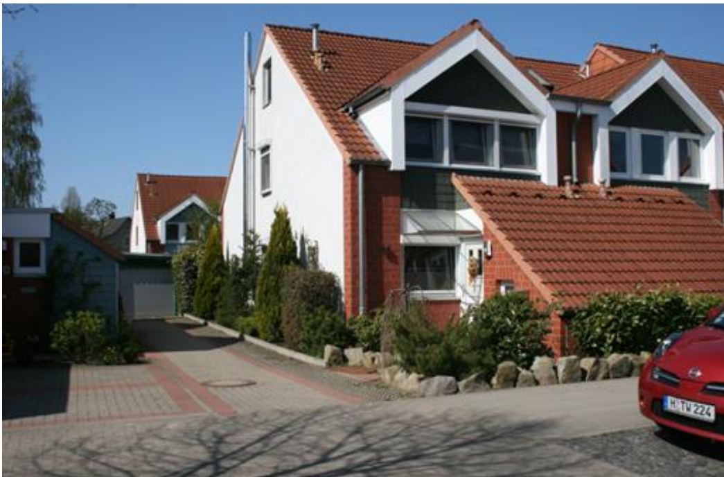
Wohnbebauung (Entfernung ca. 300 m)