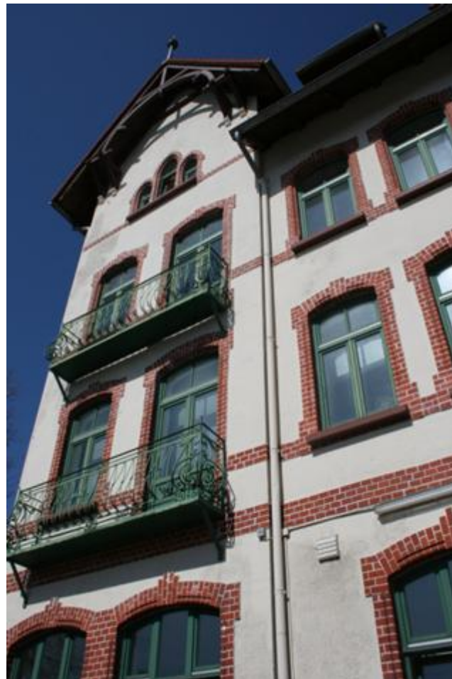
Denkmalschutzobjekt (Post, Bäcker, Büro), Entfernung ca. 50 m