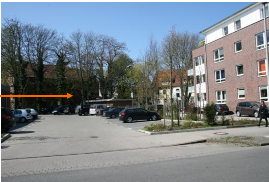
Wohnbebauung rückwärtiger Objektbereich (Entfernung ca. 50 m)