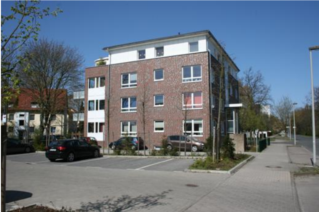
Wohnbebauung rückwärtiger Objektbereich (Entfernung ca. 50 m)