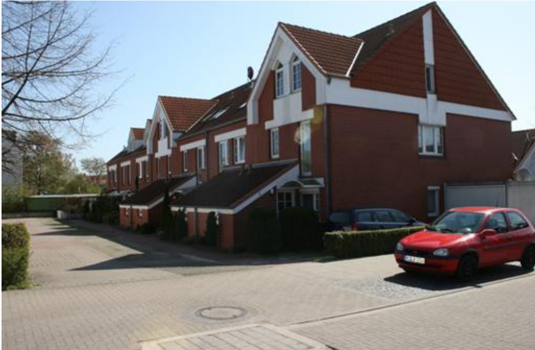
Wohnbebauung (Entfernung ca. 300 m)