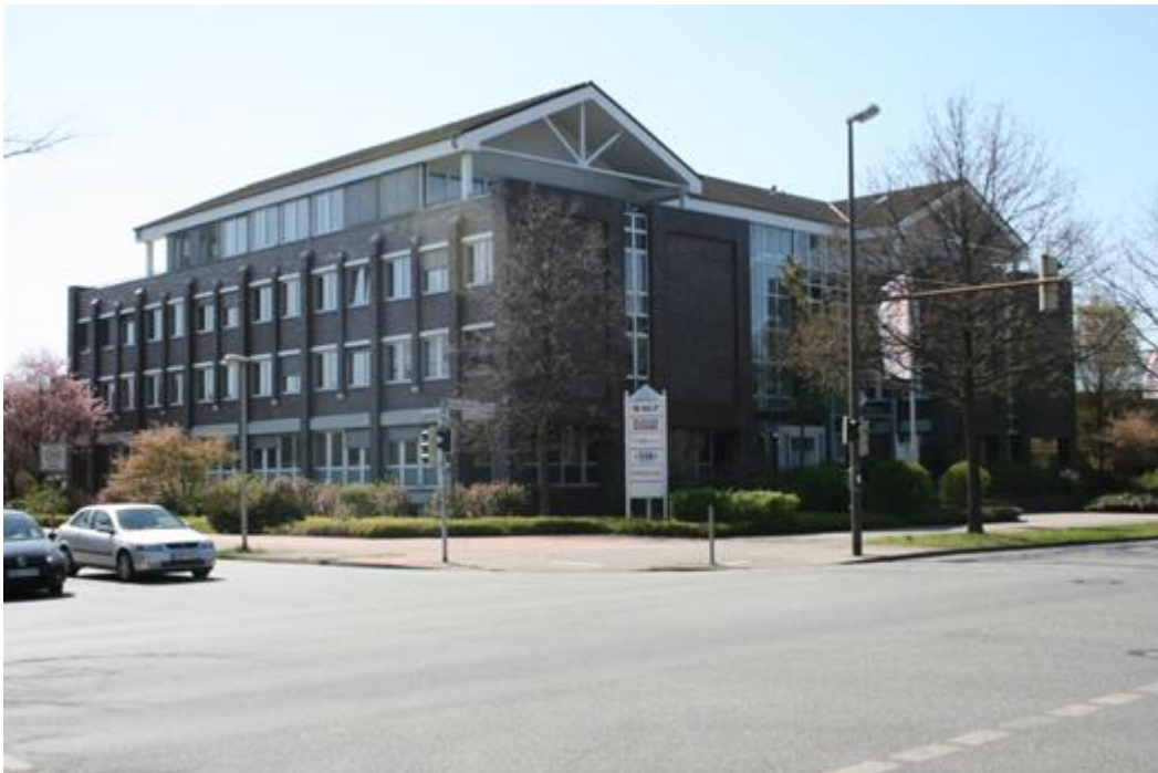
Bürolage (Entfernung ca. 1 km)